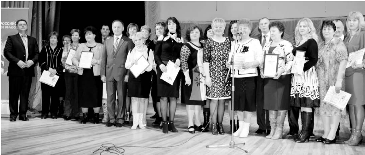
Награждение победителей конкурсов

- Особенно приятно получить заслуженную награду при большом количестве коллег, партнеров, средств массовой информации. Торжественная атмосфера Дворца детского творчества, присутствие представителей краевой Думы, Министерства образования и гостей из соседних республик подтверждает важную роль профсоюзного движения в жизни общества. Приглашение работодателей на столь значимый форум профсоюзных лидеров еще раз доказывает, что только совместными усилиями мы можем решить многочисленные проблемы педагогического сообщества. Работодатель так же, как и профсоюз, заинтересован в профессиональном росте своих педагогов, повышении их заработной платы, признании социального статуса. Социальное партнерство на всех уровнях - вот путь решения вопросов в современном обществе. Все участники форума, будь то руководитель детского сада, председатель первички, ректор вуза или студент, получили заряд положительных эмоций,